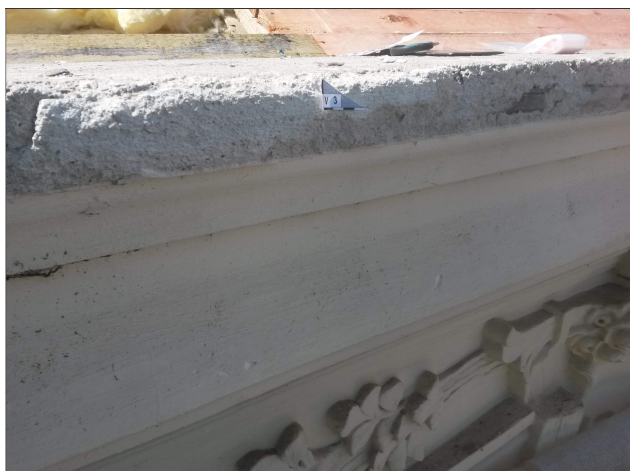
Obr. 8: Místo odběru vzorku V3 detail