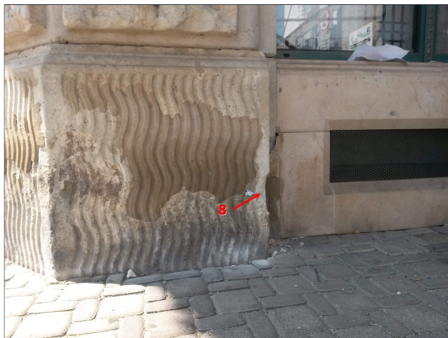
Obr. 17: Místo odběru vzorku V8