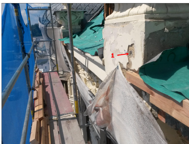
Obr. 3: Místo odběru vzorku V1