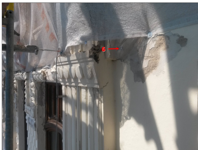
Obr. 13: Místo odběru vzorku V6