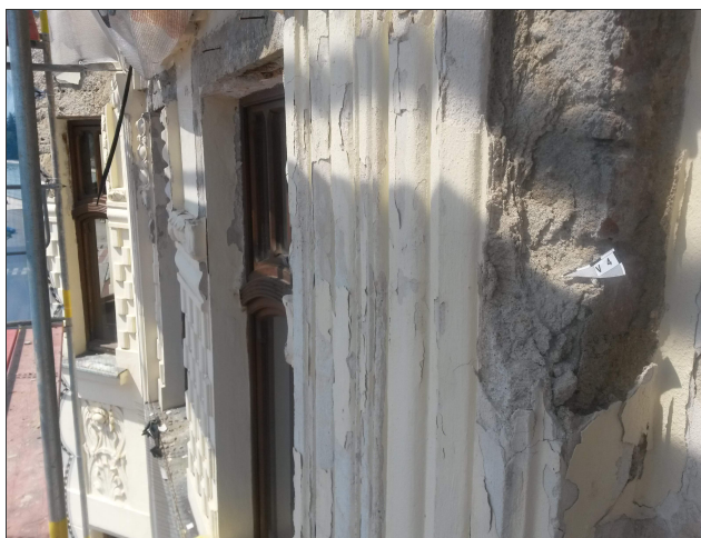
Obr. 10: Místo odběru vzorku V4 detail