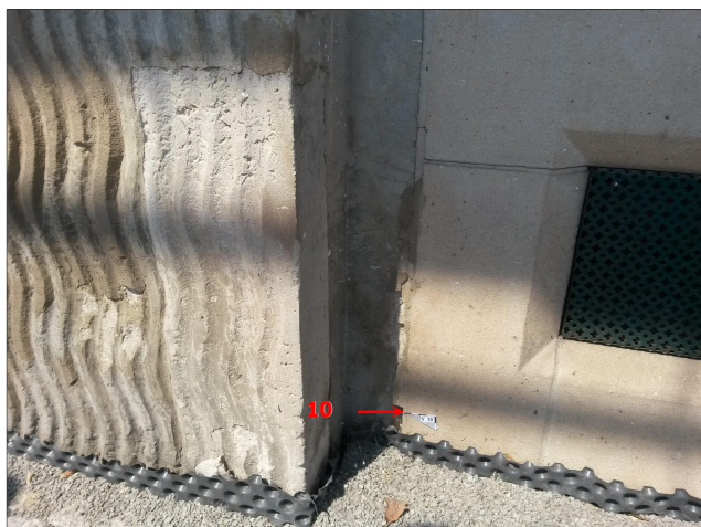
Obr. 21: Místo odběru vzorku V10