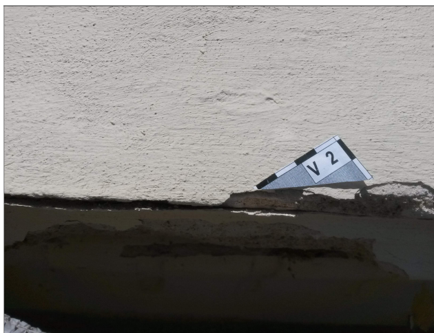
Obr. 6: Místo odběru vzorku V2 detail