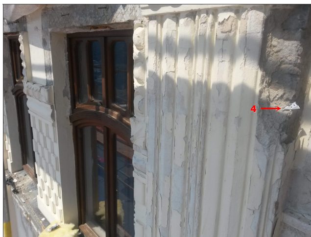
Obr. 9: Místo odběru vzorku V4