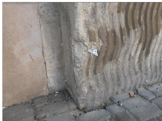
Obr. 20: Místo odběru vzorku V9 detail