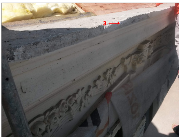
Obr. 7: Místo odběru vzorku V3