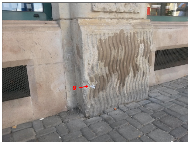
Obr. 19: Místo odběru vzorku V9