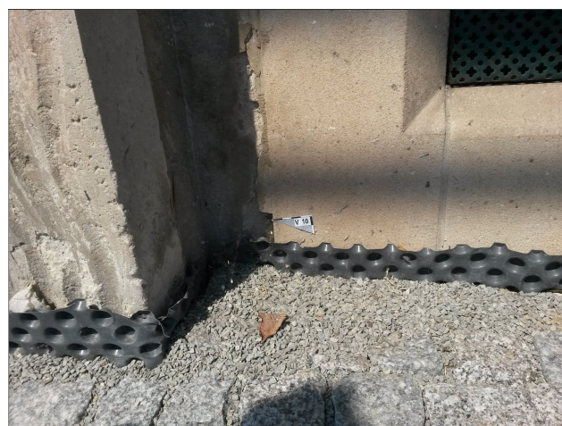
Obr. 22: Místo odběru vzorku V10 detail