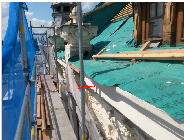
Obr. 5: Místo odběru vzorku V2