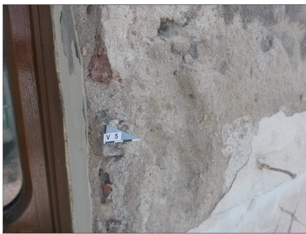
Obr. 12: Místo odběru vzorku V5 detail