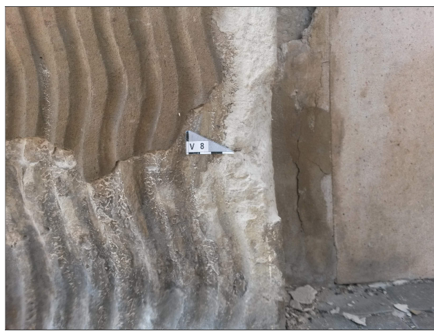
Obr. 18: Místo odběru vzorku V8 detail