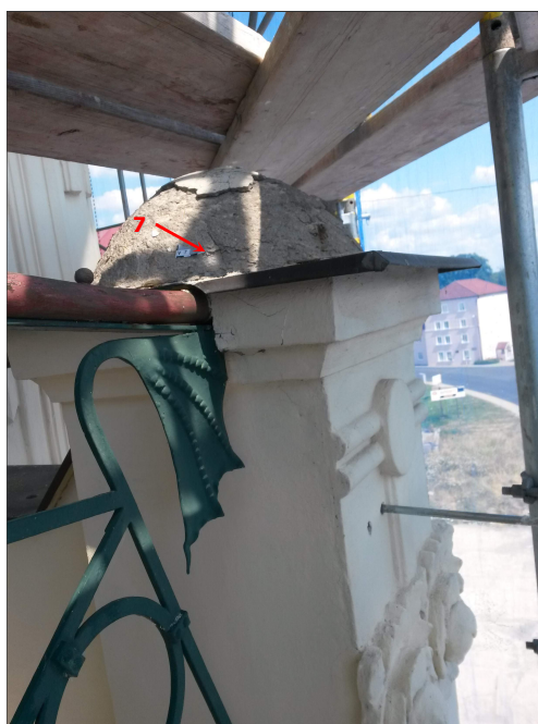
Obr. 15: Místo odběru vzorku V7