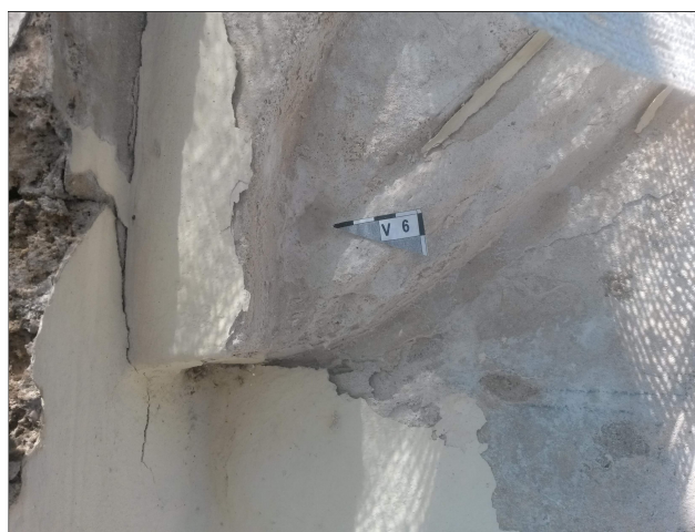
Obr. 14: Místo odběru vzorku V6 detail