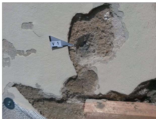
Obr. 4: Místo odběru vzorku V1 detail