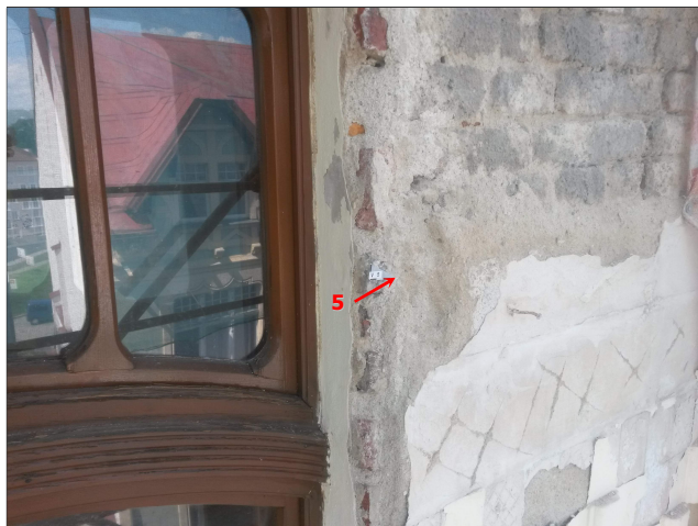
Obr. 11: Místo odběru vzorku V5