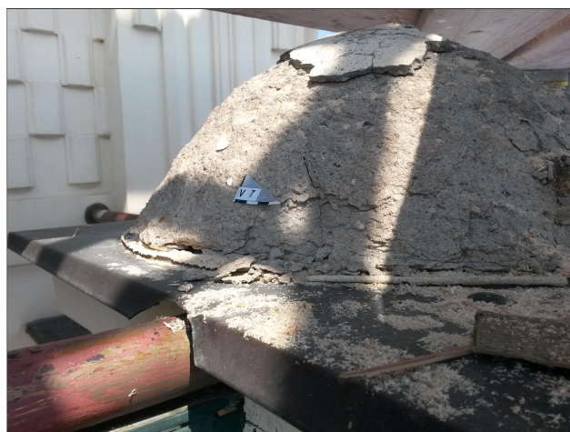
Obr. 16: Místo odběru vzorku V7 detail